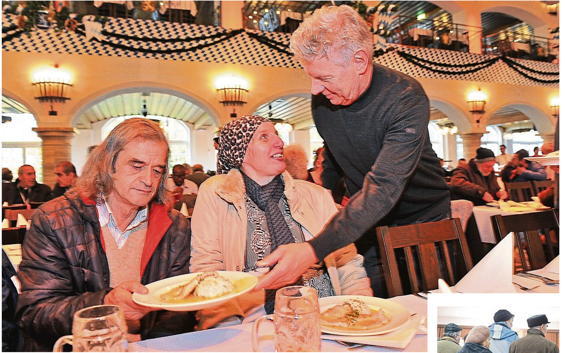
OB Dieter Reiter serviert Essen für Bedürftige. Die neue SPD-Initiative will nun auch mit einem Finanzausschuss helfen