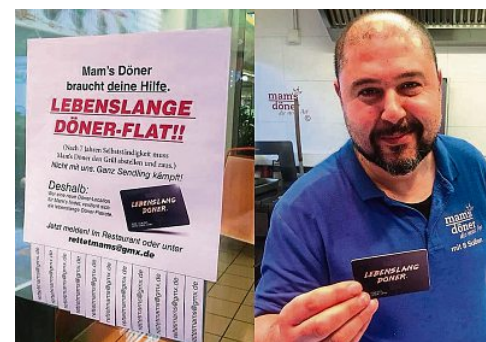
Mam's Döner sucht eine neue Bleibe

Sie wollen Gutes tun? Die Geschichten über unsere Rentnerwünsche gehen Ihnen zu Herzen? Dann können Sie mit unserer großen tz-Aktion direkt helfen: Der Münchner Verein Ein Herz für Rentner ist über Telefon 089/413 22 90 erreichbar. Er finanziert sich nur über Spenden. Mit einer Sofortspende oder Patenschaft von monatlich 38 Euro können Sie die Arbeit des Vereins unterstützen. Natürlich sorgen wir dann – zusammen mit dem Verein – dafür, dass die Wünsche unserer Rentner erfüllt werden und berichten darüber in unserer Weihnachtsausgabe. Das Spendenkonto: DE03 7015 0000 1004 6597 67, Ein Herz für Rentner e.V., Atelierstraße 14, 81671 München. Internet: www.einherzfuerrentner.de